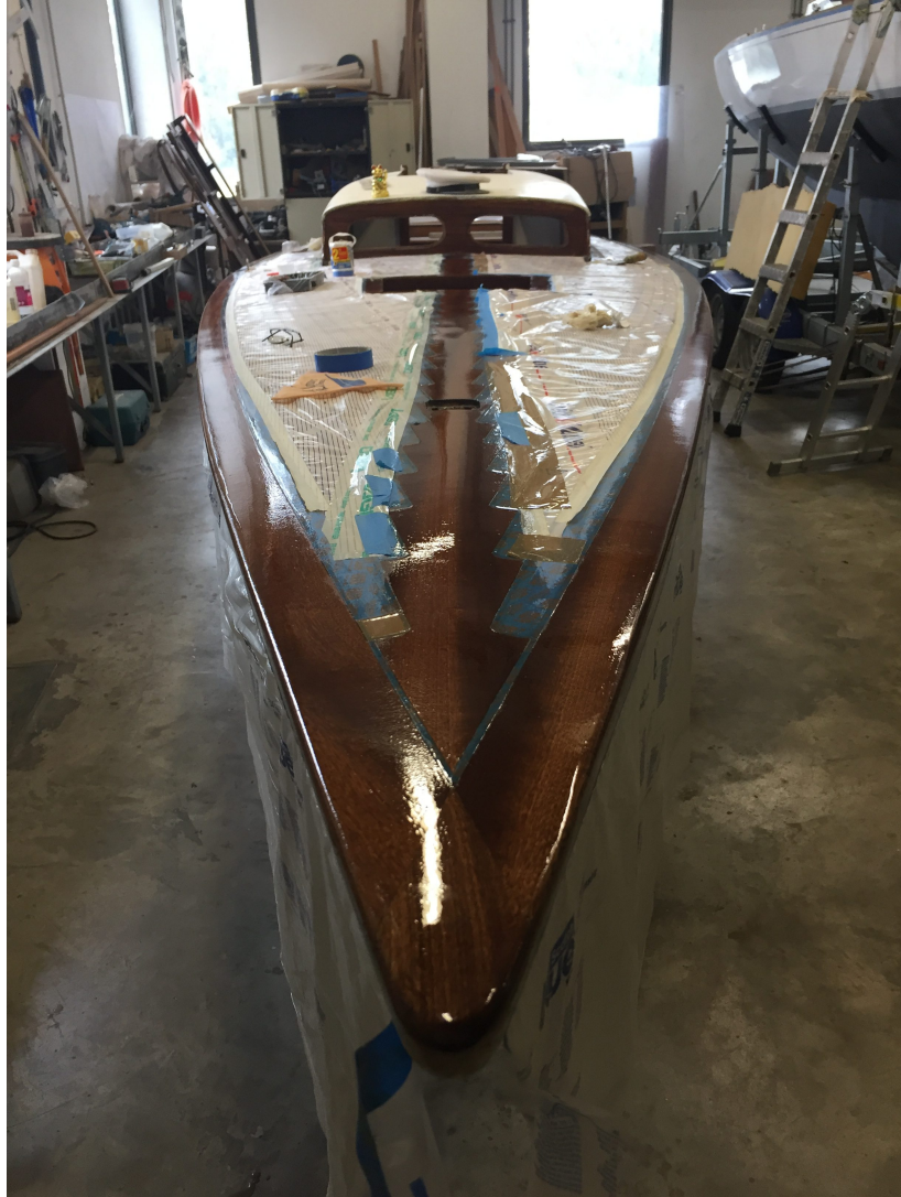
Préparation mise à l'eau