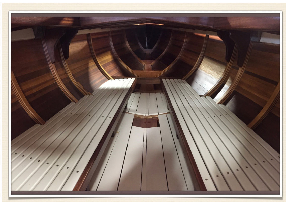
Réparation coque bâbord

DRAGON à Roger Quenet (Requin FRA499-2018)