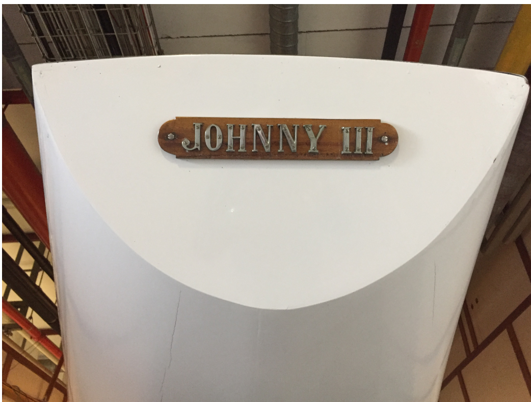
Divers moyens travaux

THOR à Pierre-Antoine Carouge (Requin FRA445-1969)