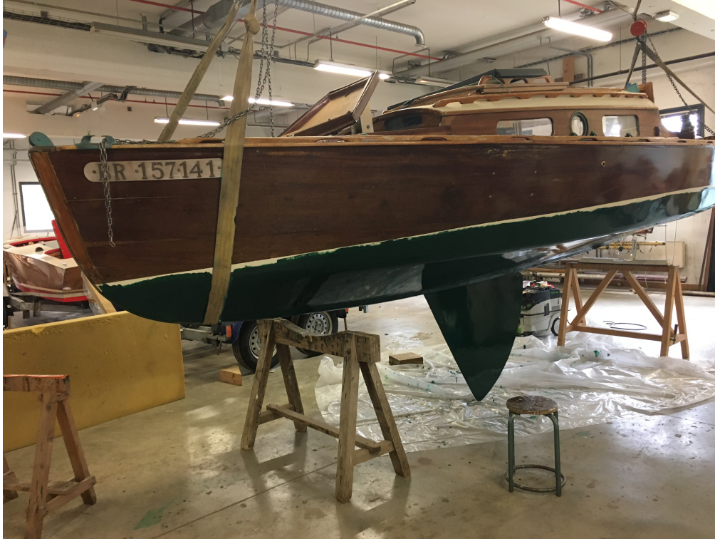
Puits de dérive, capot arrière, vernis et antifouling