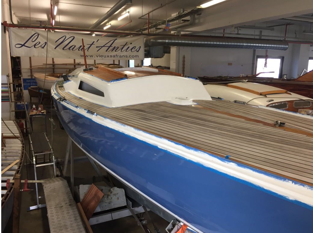
Vernis liston, roof, fougères, hiloires et mains courantes