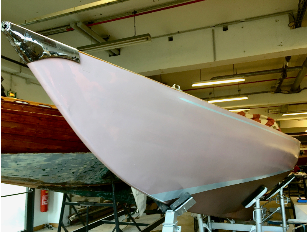
FELOUKA à Olivier Purroy (Requin)